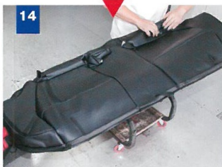
14 後席座面は車体から外しての作業。シートベルトの脱着にはトルクスレンチを使う。