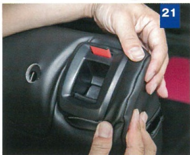
21 ヘッドレストの挿入部や前倒しレバーなど、樹脂パーツを端からカバーに通す。