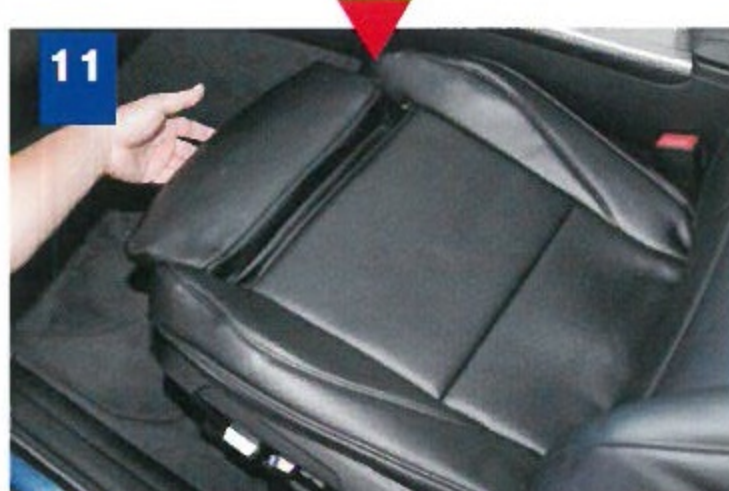
11 レッグ部の調整機構が稼働するのを確認。隙間の部分もきれいに整えてやろう。