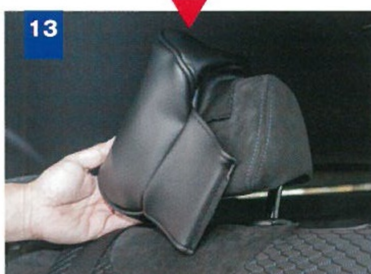
13 後席のヘッドレストは、側面からカバーをはめ込む。裏の固定は前席と同様だ。