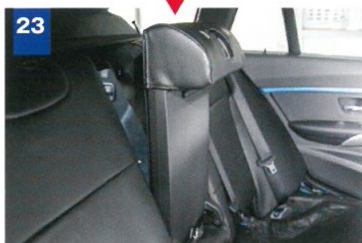
23 アームレストのベース部にもカバーを装着。ヘッドレスト挿入部も他と同様に通す。