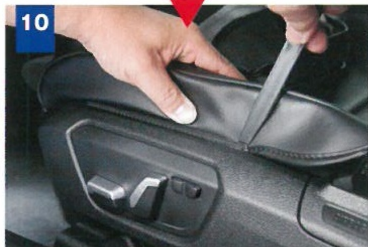
10 付属のヘラを使い、シートカバーのサイド部を側面の樹脂カバー内へ押し込む。