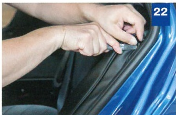
22 両端のサイドウイングという内装にもカバーを被せる。端からヘラで押し込もう。