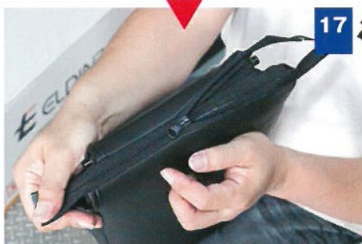
17 後席センターのアームレストを工具を使って外し、カバーをすっぽりと被せる。