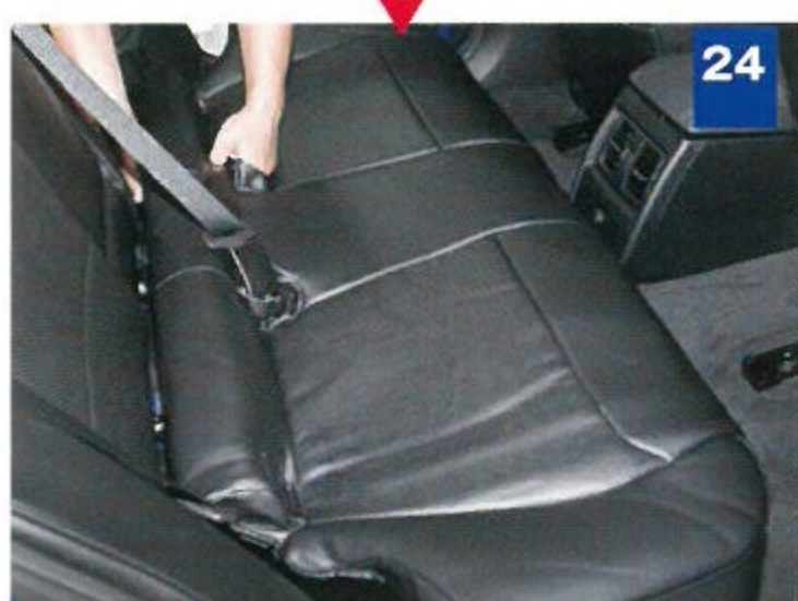
24 後席座面を元通りに固定。通しにくいバックルは、ベルトで保持すると効率的だ。