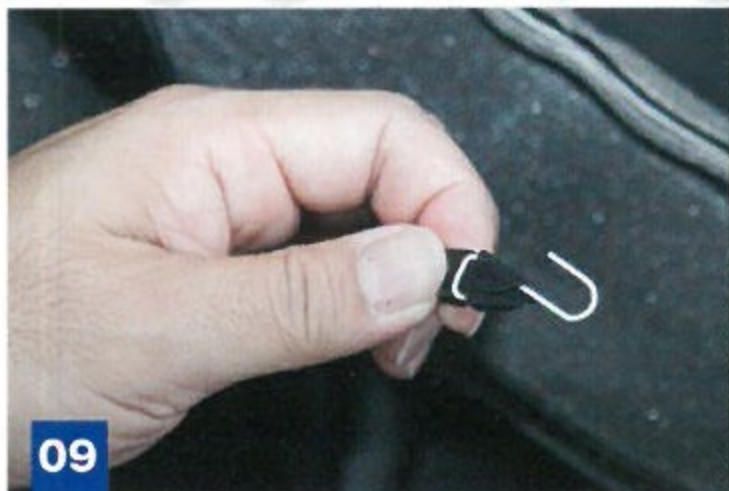
9 付属のS字フックを説明書の指示通りにセット。座面裏側の支持部分へ引っ掛ける。