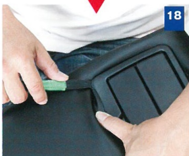
18 ドリンクホルダーの樹脂パーツを、ヘラを使って端からカバーの穴へ通してやる。