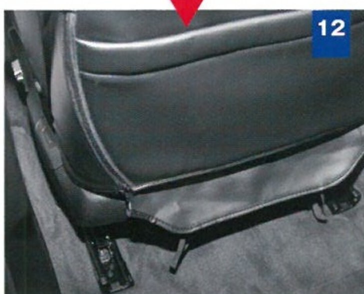
12 座面後部を後方に引き出し、付属のS字フックを付けて裏面に固定する。