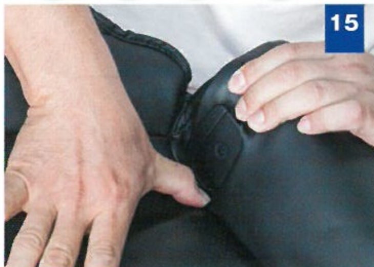
15 座面全体にカバーを被せ、樹脂パーツ部は端から穴へ通してやる。優しく押すコト。