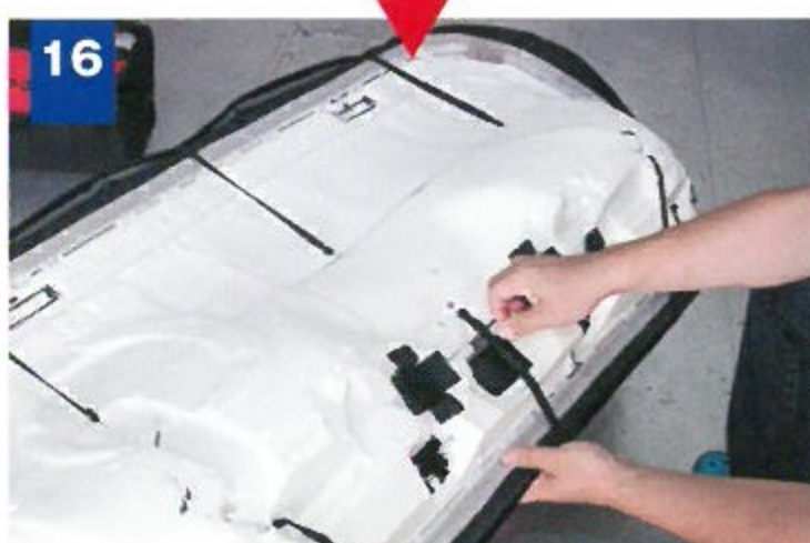
16 付属のS字フックを使い、全周を裏面に固定する。シートベルト穴は後回しだ。