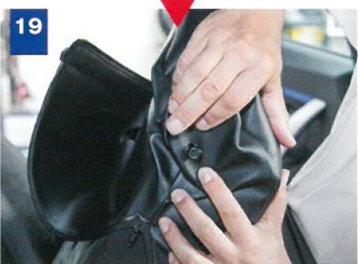
19 後席の背もたれは固定フック側からカバーを被せ、破らないように注意して覆う。